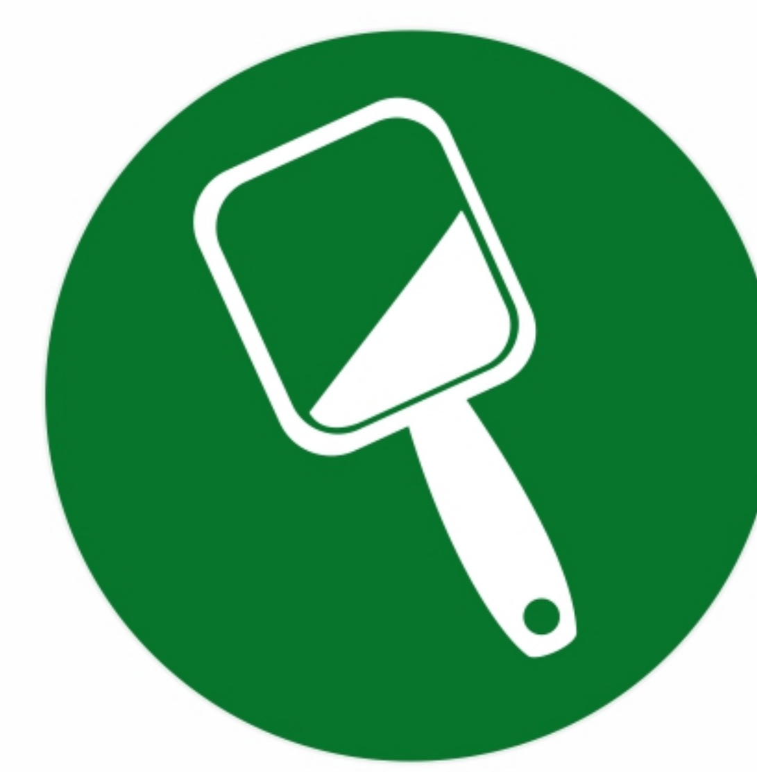
предметы домашнего обихода

Крупногабаритные отходы вывозятся без взимания с населения дополнительной платы.