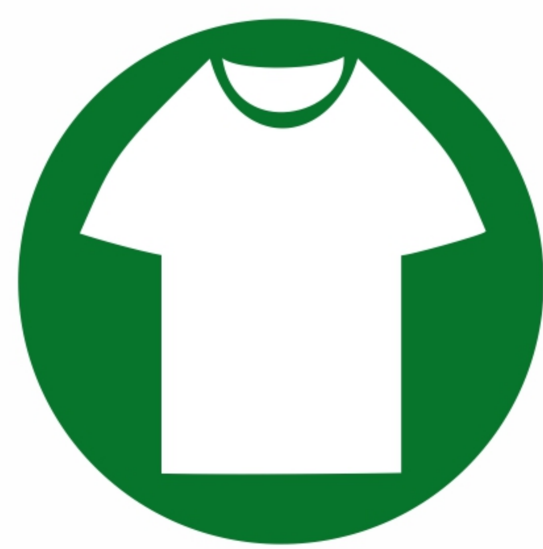
товары народного потребления