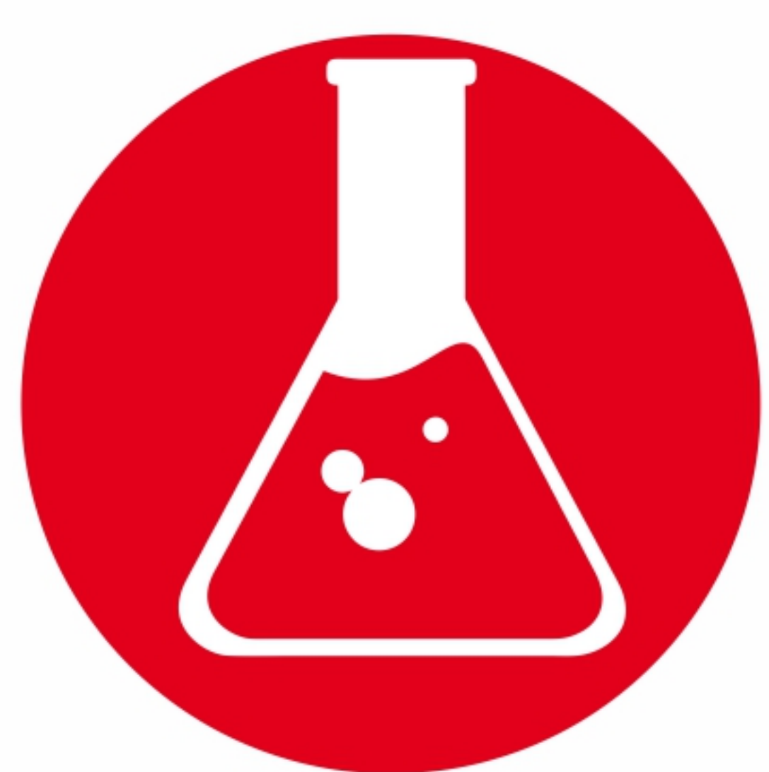
медицинские и жидкие бытовые отходы