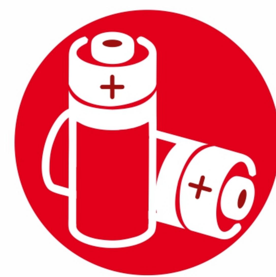
аккумуляторы и батареи